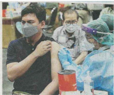
ดีใจได้ดี ประชาชนไปเข้ารับการฉีดวัคซีนโมเดอร์นาเข็มที่ ๒ ในโครงการ "นมท์บูตเตอร์" ของอบจ.นนทบุรีด้วยความดีใจที่ได้ฉีดวัคซีนป้องกันโควิด-19.