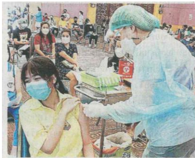
ฉีดนักเรียน รพ.นครปฐม เปิดอถุ์กอินให้โรงเรียนต่างๆนำนักเรียนมาฉีดวัคซีนไฟเซอร์ทั้งเข็มแรกและ 2 ที่ศูนย์ฯอุทยานการอาชีพพัฒนา จ.นครปฐม.