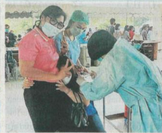
กล้าใจเป็น ส.ส.ชาติตาเรียนทัพผอ.ร.ร.อภิลศรบุรี อ.สรรคบุรี จ.ชัยนาท กอดให้กำลังใจครูสาวที่มาฉีดวัคซีนไฟเซอร์เข็มแรก ที่มรภ.จันทราเกษมชัยนาท.